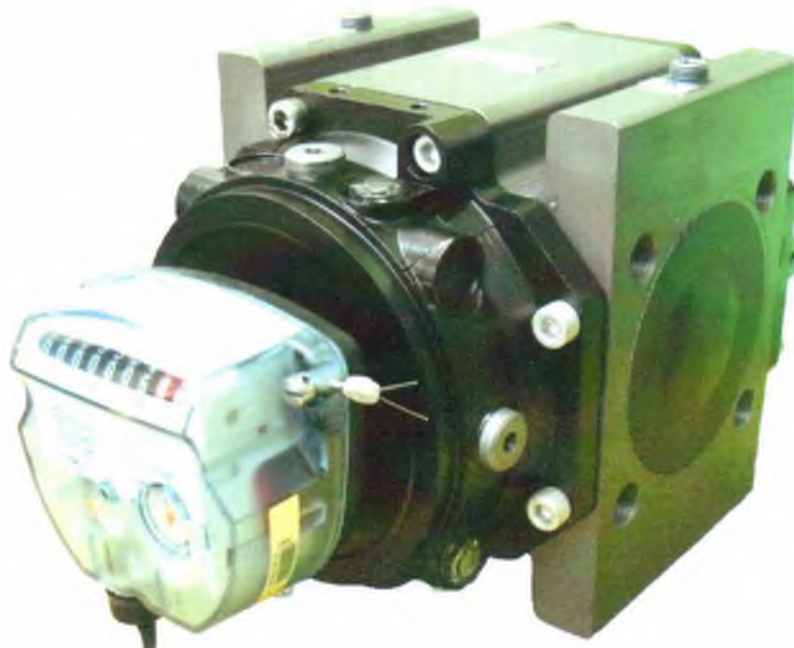
Рисунок 1 – Общий вид счетчиков РСГ СИГНАЛ