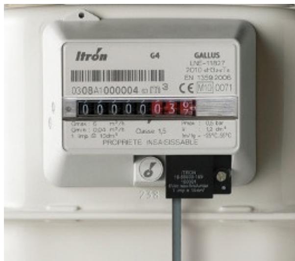
Рис. 2.5. НЧ датчик импульсов, смонтированный в гнездо отсчетного устройства счетчика