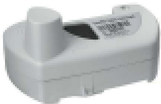
Рис. 2.3. Модуль EverBlu Cyble