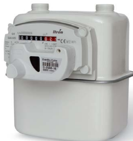
Рис. 2.4. Модуль EverBlu Cyble, смонтированный на отсчетное устройство счетчика