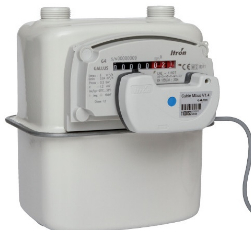
Рис. 2.2. Датчик Cyble_Sensor_ATEX V2, смонтированный на отсчетное устройство счетчика